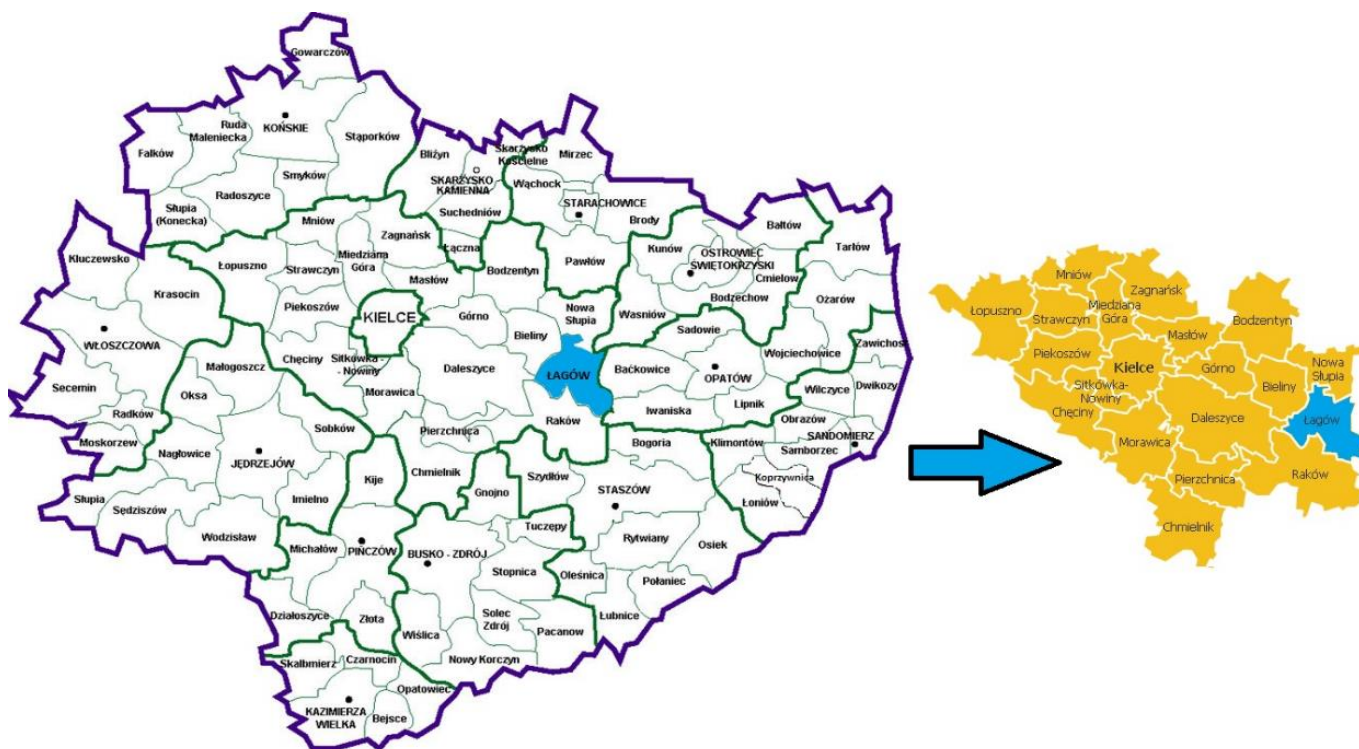
Mapa 1 Lokalizacja Gminy Łągów na tle województwa świętokrzyskiego i powiatu kieleckiego