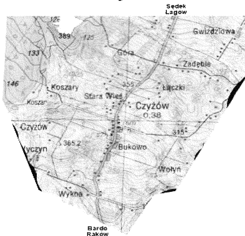
Rys. 1. Lokalizacja miejscowości Czyżów.